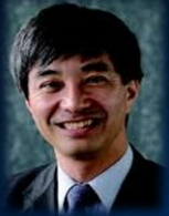
Hiroshi Maruyama Institute of Statistical Mathematics

Challenges for Big Data in our Society: Statistical Analysis of Large Scale, High Dimensional Data for Socio-Economic Problems