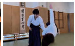
「武道留学」という新しい試みで 合気道の魅力を発見し、伝える