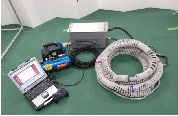
図1 能動スコープカメラ