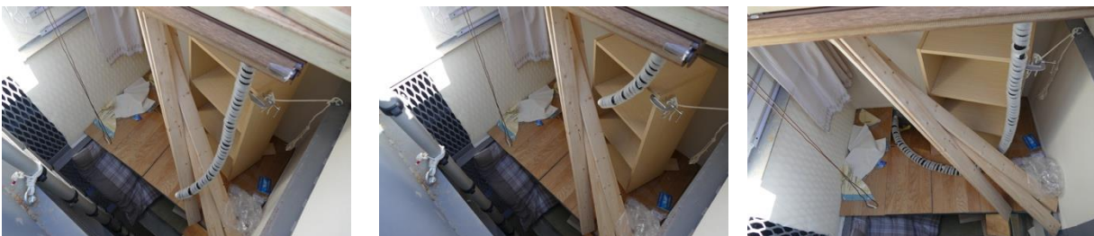
図4 熊本地震の倒壊木造家屋の内部を模擬した瓦礫空間への能動スコープカメラの進入