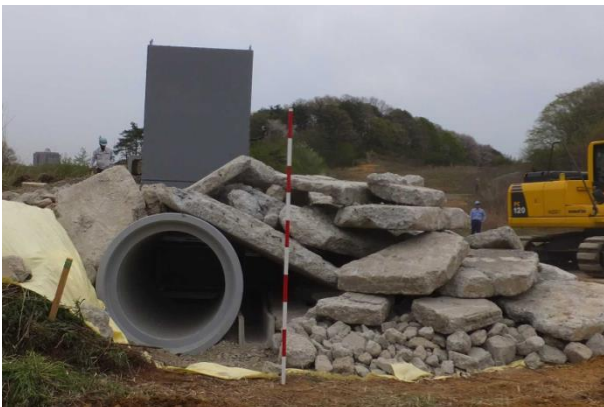
図3 屋外フィールド評価のための瓦礫

熊本地震の現地調査に基づき、倒壊木造家屋の内部を模擬した試験評価用瓦礫を製作し、本システムの実証実験を行ったところ、これまでと比較して飛躍的に高い聞き取り性能を確認することができました（図3、図4）。