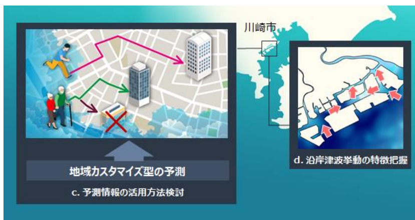
図3: 地域カスタマイズ型の津波事前対策