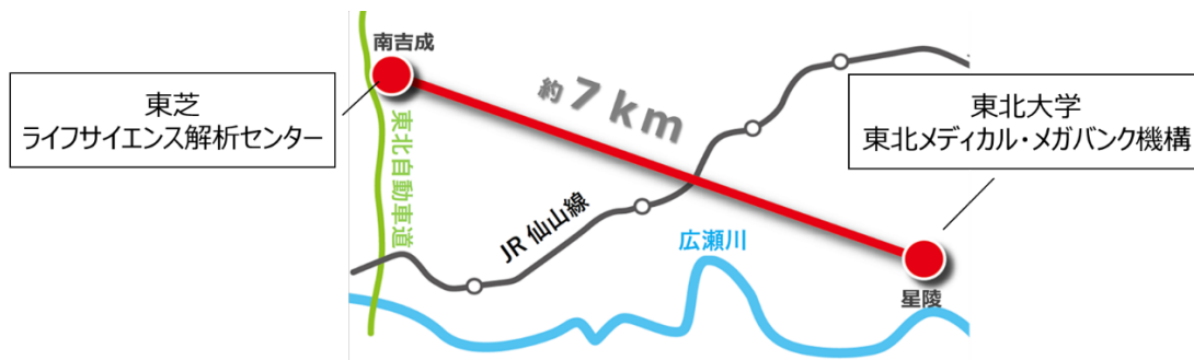
図 2 伝送拠点と伝送経路の概要