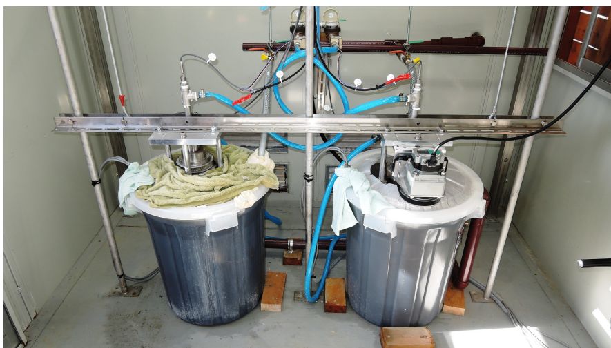
図3 実証試験の様子