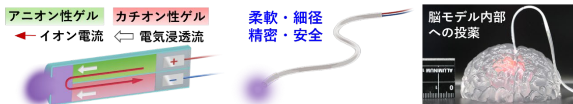
図1 電気浸透流ピペットの構造と原理、および脳モデルへの挿入

本成果は、2023年9月7日に材料分野の専門誌 Advanced Functional Materials にてオンライン公開されました。