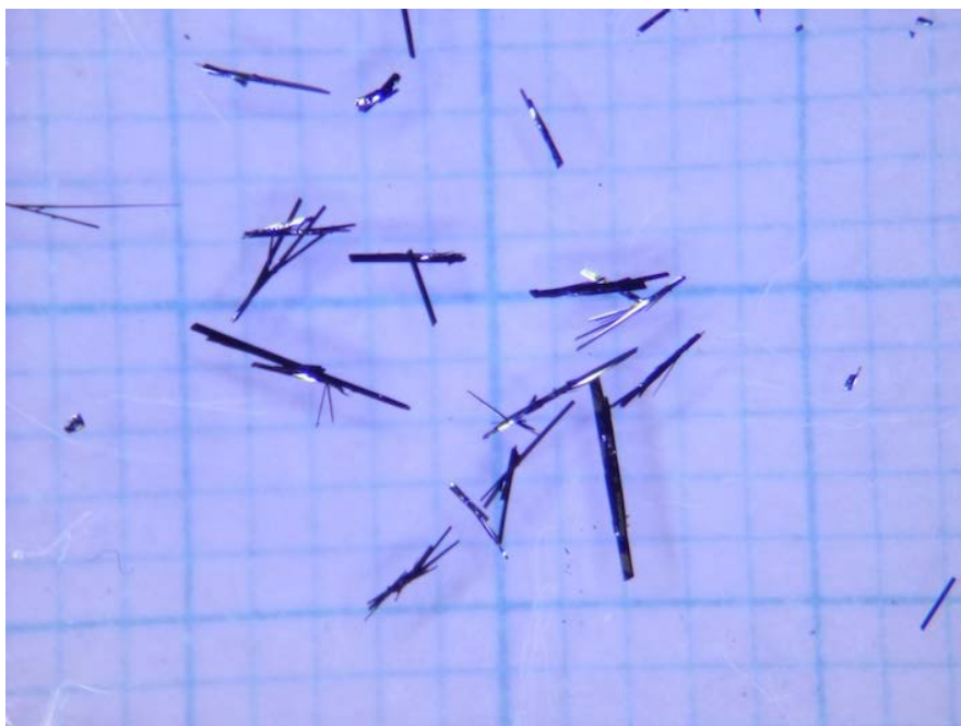
図 1 : 測定に使用した有機化合物 \beta -( meso -DMBEDT-TTF) 2 PF 6 の写真。数ミリ程度の長さをもった細長い形状をしている。