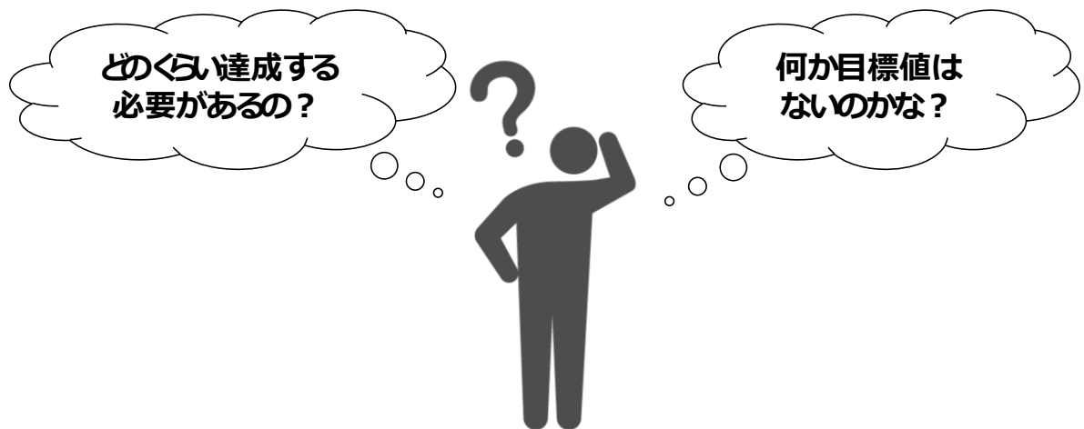
図1. 本研究で解決する疑問

高血圧予防のために、 定期的に運動をして体力を高々維持しようと言われるけれど..