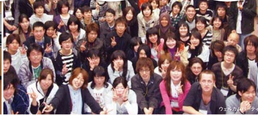
ウェルカムパーティ