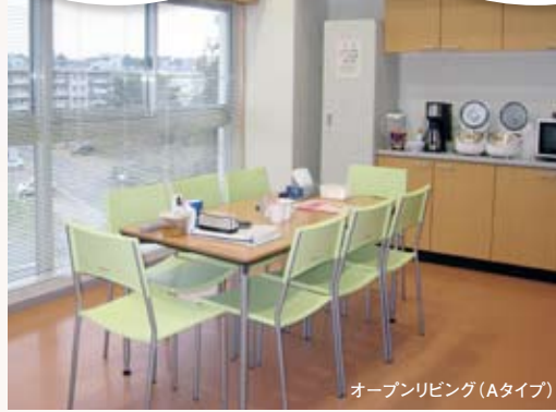
オープンリビング(Aタイプ)