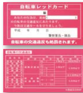
仙台中央署管内における東北大生に対する自転車レッドカード交付状況 (2009.1.1～8.31) ※件数には、口頭による注意、警告等は含まれません。

自転車等二輪車の交通マナーの改善については、これまでも再三注意を促してきたところです。宮城県警では、自転車利用者に対する交通安全指導として、交通ルール違反行為に対し「自転車レッドカード」を活用して安全な乗り方の指導を行っています。今年の仙台中央警察署管内における本学の学生に対するレッドカード交付状況は、次表のとおりとなっています。