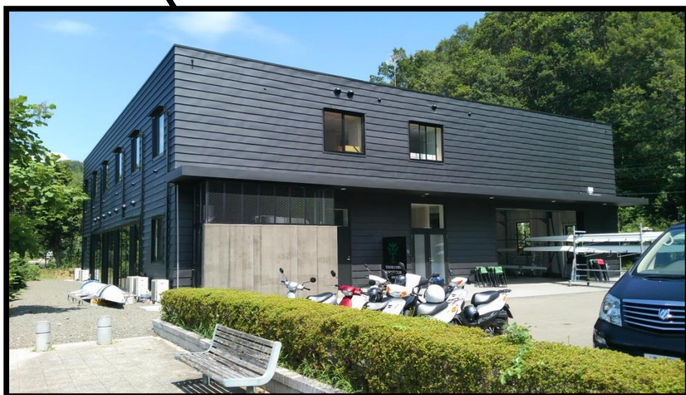
← 会場（釜房ボート艇庫）外観

東北大学川内北キャンパスから車で約45分。自家用車でお越しの方は無料の駐車場を利用できます。また、交通手段の一つとして、株式会社タケヤ交通のバス「秋保・川崎 仙台西部ライナー」（乗車予約優先）がございますのでご案内します。