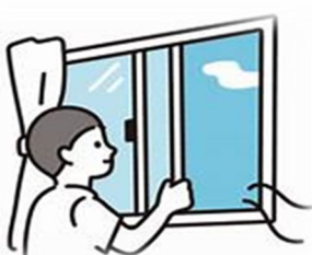
換気 (定期的な換気)