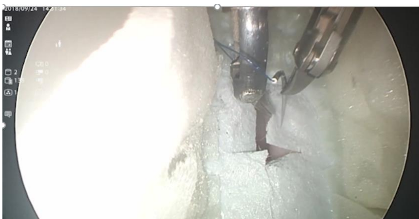
図 2. 内視鏡下で硬膜モデルに針を刺す様子 (ロボット術具は直径 3.5 mm で先端が屈曲する)