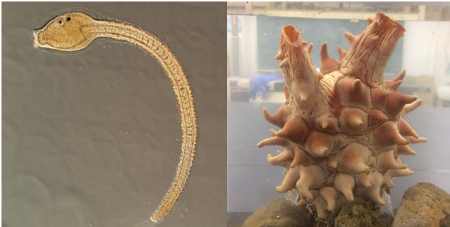
マボヤの幼生(左)と成体(右)