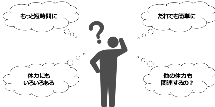
図 1. 本研究で解決する疑問