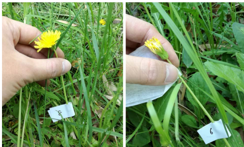
図1. 授粉していないタンポポ（左）と、授粉したタンポポ（右）。同日同時刻に撮影。

本研究成果は、2019年8月6日（火）（日本時間午前3時00分）に国際専門誌「Evolutionary Ecology」誌で公開されます。