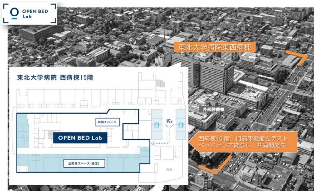
図2 OPEN BED Lab 概要