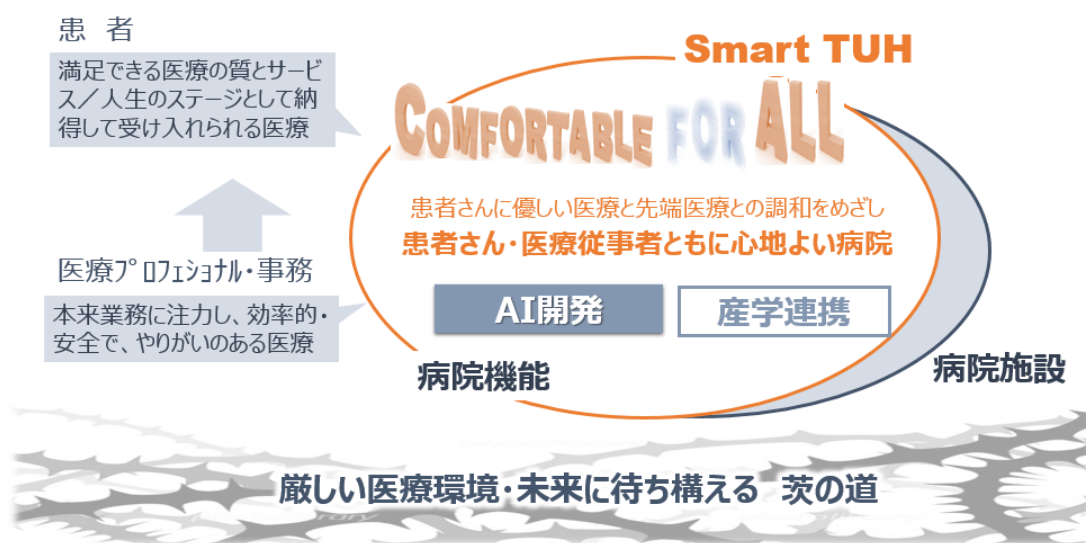
図1 東北大学病院スマートホスピタルプロジェクト