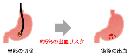
早期胃癌内視鏡治療後の出血予測モデルを開発

本研究成果は、日本時間2020年6月5日午前10時 Gut 誌（電子版）に掲載されます。