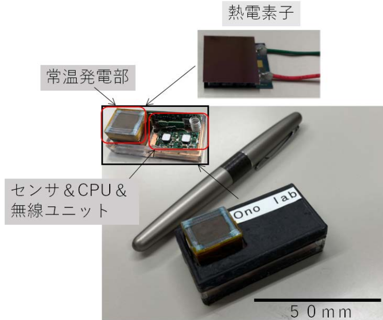
図1. 開発した常温発電デバイス。(サイズ比較のためペンを置いてある。)左上の 挿入図は、内部構造であり、蓄熱部、熱電素子、放熱構造(裏側)、センサ、CPU、 無線ユニットから構成されている。

本研究は、内閣府が進める「戦略的イノベーション創造プログラム(SIP) *3 第2期／ フィジカル空間デジタルデータ処理基盤」(管理人:NEDO)によって実施されまし た。