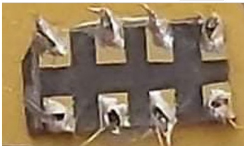
図1. 酸化亜鉛試料の写真

酸化亜鉛試料の電気測定にはチタン電極を蒸着し、電極に対してインジウムを用いた半田で配線を行います。