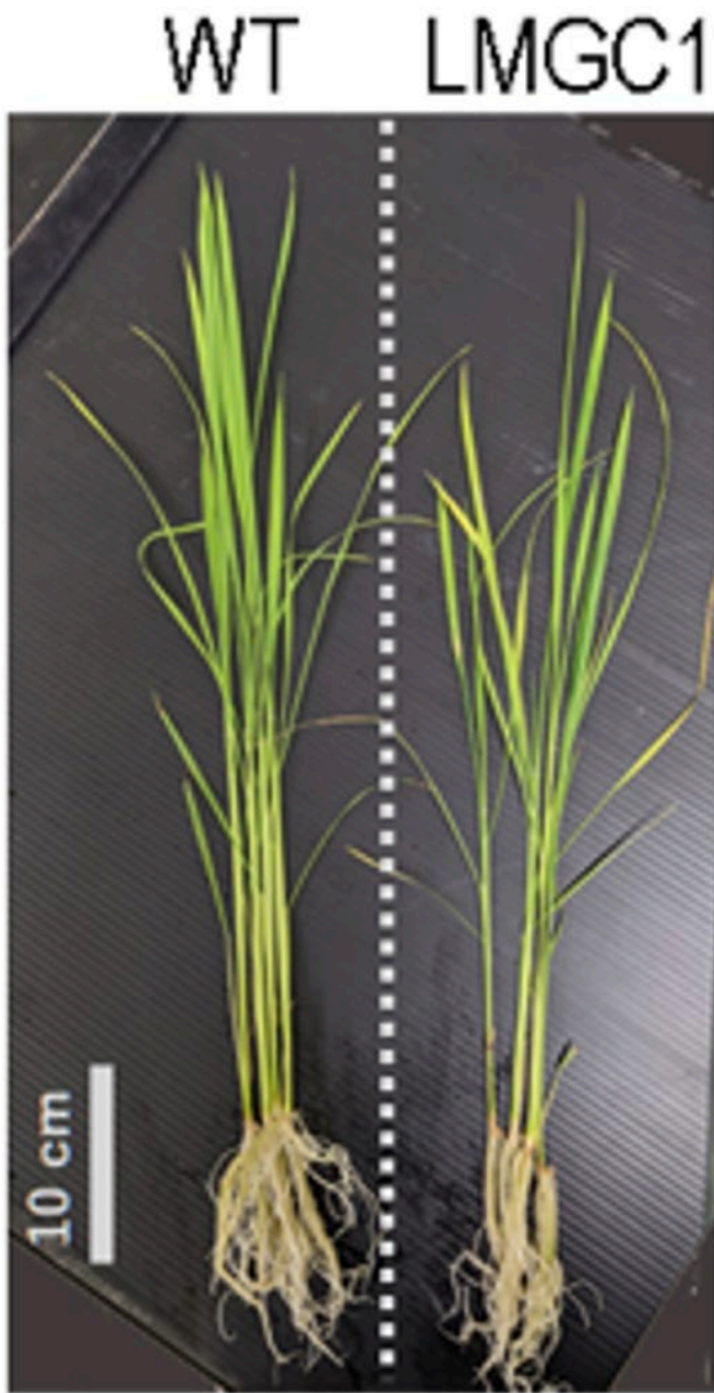
図2 選抜した突然変異イネ LMGC1 をマグネシウム欠乏条件で生育させた場合。