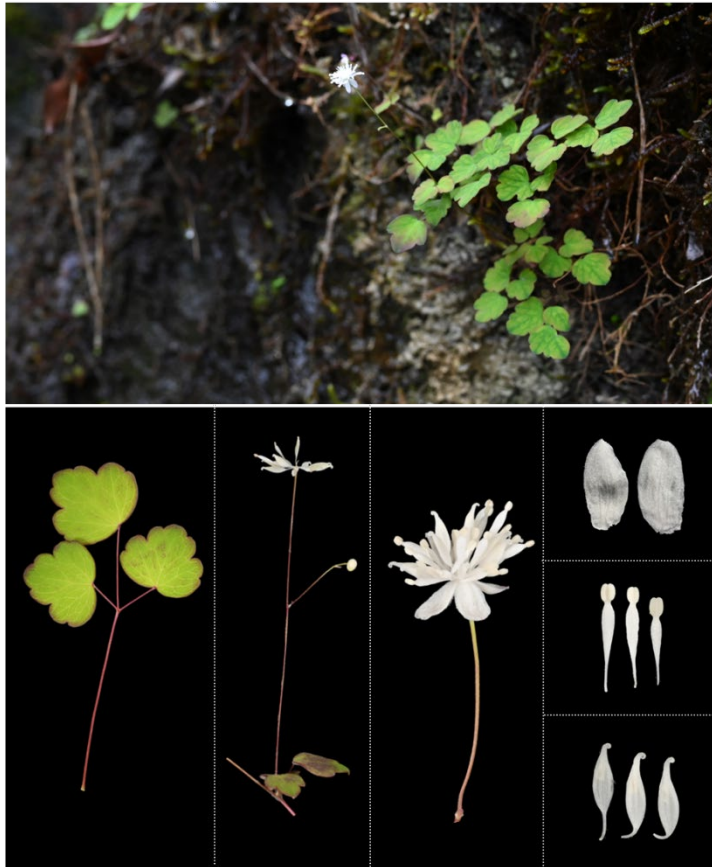
図 3. 台湾固有のタカサゴカラマツの自生地および花、葉の詳細な形態