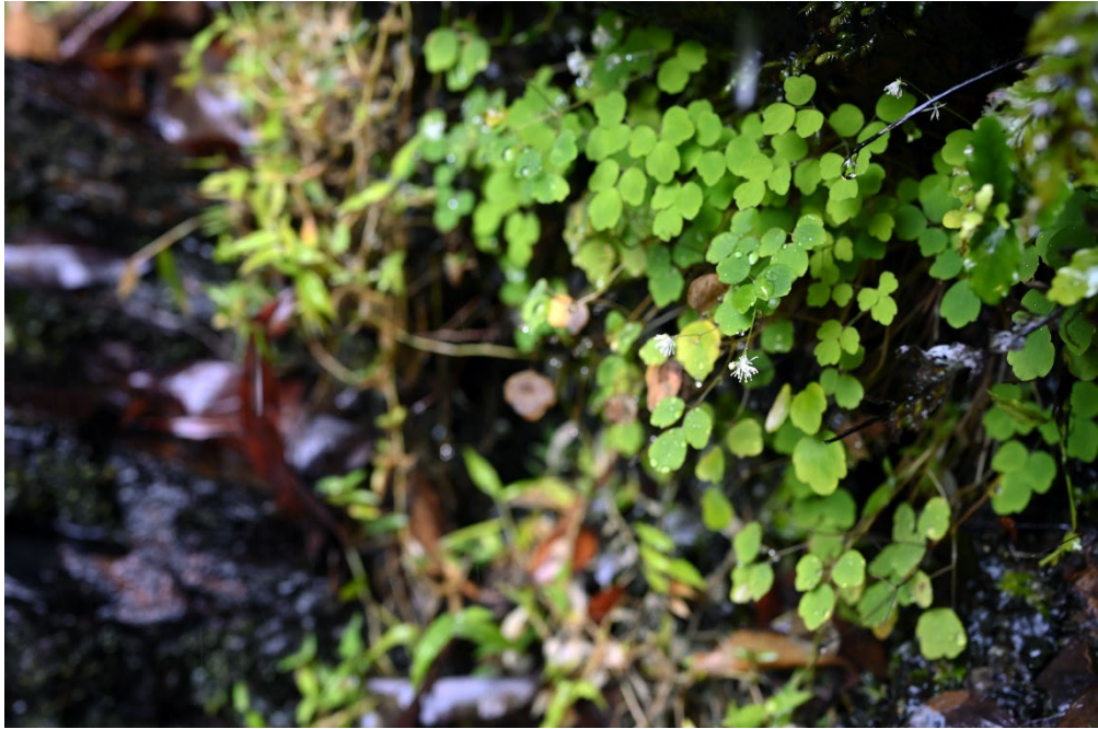
図 1. ヤンバルカラマツの自生地