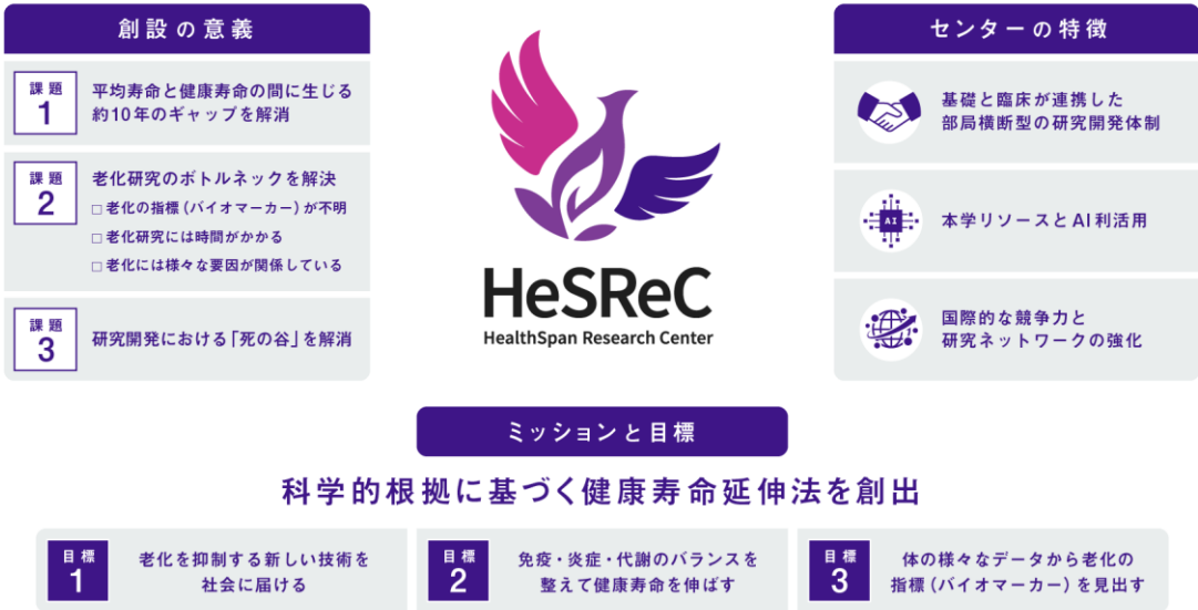
図 1. HeSReC の概要