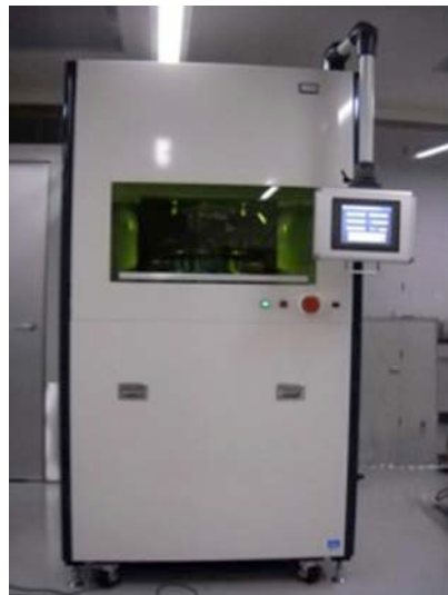
図 1 新たに開発したナノインプリント装置

例えば、強化ガラス製ハードディスク基板上の Pd-Cu-Ni-P 系金属ガラス薄膜 (厚さ約 20nm) に転写したナノパターンの外観を図 2 に示します。直径 2.5 インチ基板の全面に渡りナノパターンが転写されていることが見てとれます。