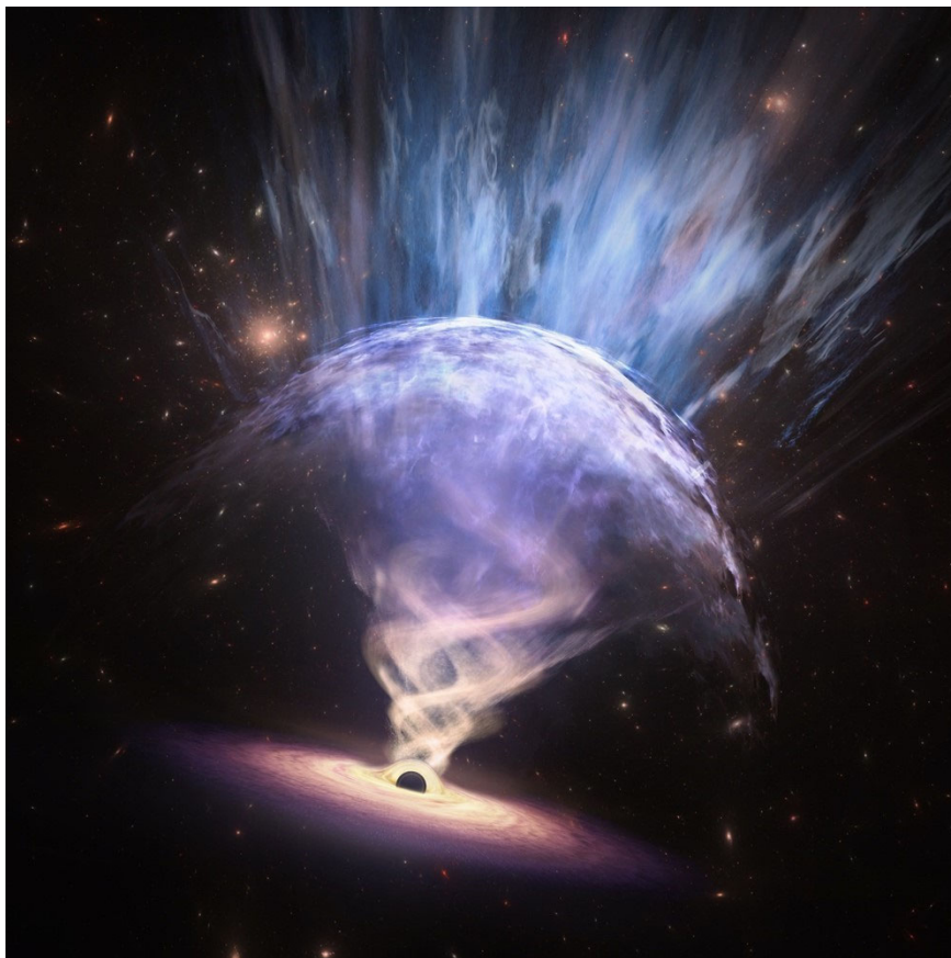
ガンマ線バーストのイメージ図

ガンマ線バーストは、数秒から数百秒の短い時間で爆発的にガンマ線を放つ天体現象です。宇宙のあらゆる天体現象より明るく輝く爆発現象でありながら、いつどこでガンマ線バーストが起きるか分からないため、事前に予測して観測することが難しくその正体はよく分かっていませんでした。これまでの多くの観測や理論研究によって、太陽よりもずっと重い星が自身の重力で潰れて崩壊するときに、ガンマ線バーストが起きると考えられています。星が崩壊し、中心部にブラックホールが生まれた瞬間に、プラズマのジェットが光速に近い速度で噴き出し、ジェットの内部で衝撃波が形成されます。そして、その衝撃波の中で高エネルギー粒子が加速され、磁場と相互作用することでガンマ線を放射すると考えられています。しかし、このガンマ線バーストのジェットの速度の極限ともいえる光速に近い速度までどのように加速し、衝撃波の内部にどのような磁場が形成されてガンマ線が生まれるのかよく分かっていませんでした。