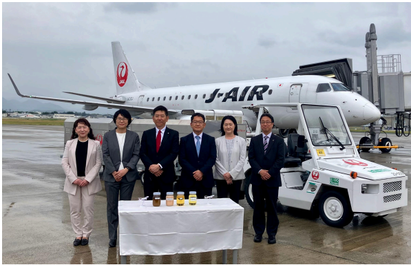
使用開始当日のフォトセッション(*1)