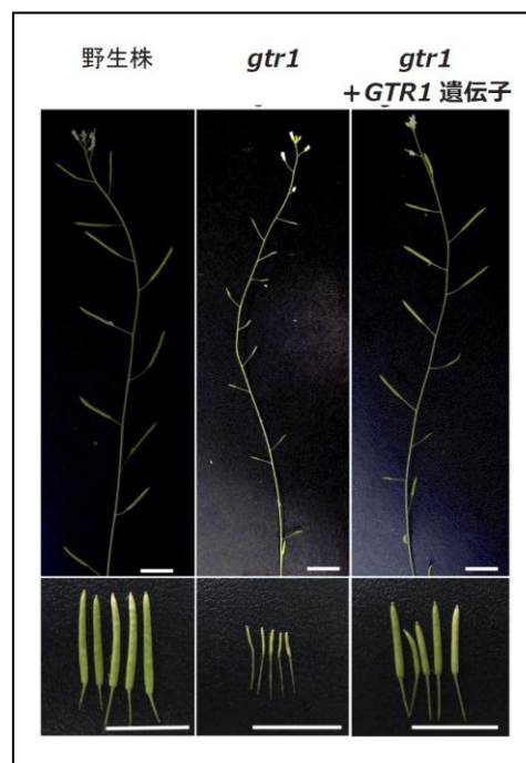
図1 野生株（左）と比較して gtr1 （中）は稔性が低下しているため、莢（さや）は短く少数の種しか得られない。 gtr1 に人為的に GTR1 遺伝子を導入した植物（右）では稔性が回復した。

本研究では、モデル植物であるシロイヌナズナの遺伝子発現パターンを解析し、ジャスモン酸の合成遺伝子とよく似た発現パターンを示す遺伝子に着目した。この遺伝子にコードされている輸送体「GTR1」は、アブラナ科の植物で生産される病虫害防御物質であるグルコシノレート（用語5）の輸送体であることが報告されていた。GTR1 輸送体の機能を失った植物体 ( gtr1 ) を作成し花の発達過程を調べたところ、雄しべの発達に異常が生じ雄性不稔となっていること、 gtr1 に人為的に GTR1 遺伝子を導入して GTR1 の機能を相補すると、稔性が回復することが明らかになった（図1）。