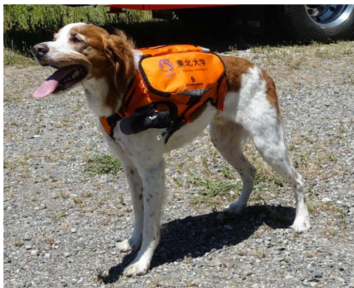
図1. 災害救助犬による人の搜索を遠隔モニタリングする新型サイバー救助犬スーツ

現場に行く部隊の装備を目指し、15kg以上の中型・大型犬が装着することができ、オレンジ色と再帰反射素材で視認性と高め、防水性能を高めたタフなサイバー救助犬スーツを開発しました(図1)(表1)。東京国際消防防災展2018(5月31日～6月3日、東京ビッグサイト)でタフなサイバー救助犬スーツを展示いたします。