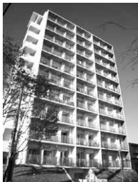
ユニバーシティ・ハウス三条