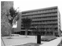
ユニバーシティ・ハウス青葉山