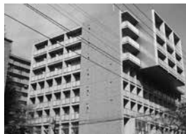
ユニバーシティ・ハウス片平