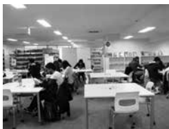
グローバル学習室で国際交流も