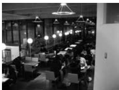
食事ができる休憩用ラウンジ