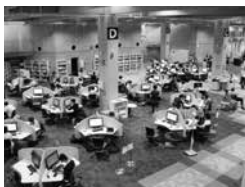
広々とした PC コーナー