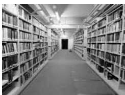
130万冊以上を所蔵する書庫