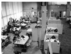
一人でも友人とでも使える閲覧席