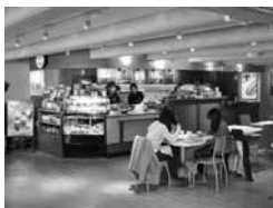
カフェで休憩&国際交流