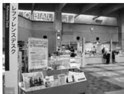
各種サービスカウンター

本館は、資料を多数取り揃えているのみならず、一人で静かに勉強する、グループでディスカッションをする、データベースを使って調べものをする、カフェで気軽に休憩する、といったさまざまなスタイルで利用をすることができます。