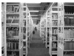
学生閲覧室の図書20万冊