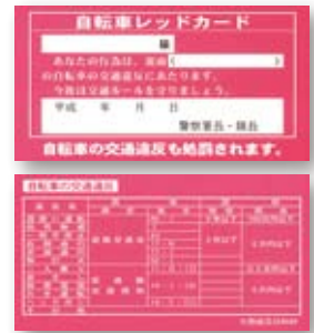
仙台中央署管内における東北大生に対する自転車レッドカード交付状況 (2009.1.1～8.31)

自転車等二輪車の交通マナーの改善については、これまでも再三注意を促してきたところです。宮城県警では、自転車利用者に対する交通安全指導として、交通ルール違反行為に対し「自転車レッドカード」を活用して安全な乗り方の指導を行っています。今年の仙台中央警察署管内における本学の学生に対するレッドカード交付状況は、次表のとおりとなっています。