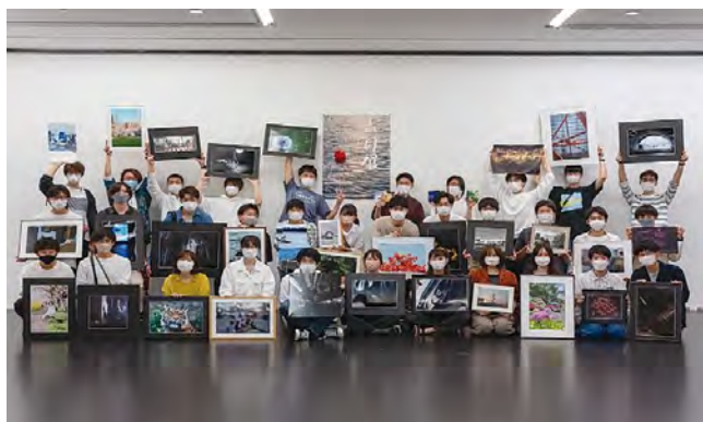
▲学友会写真部の活動風景

大学生という長くて短い時間を写真として残していくこと、いまの自分から見えている世界を周りの人と共有すること。写真には様々な喜びがあります。次回の写真展は10月末の学祭展です。ぜひ写真作品を通じて、私たちから見えている世界を覗きにいらしてください。