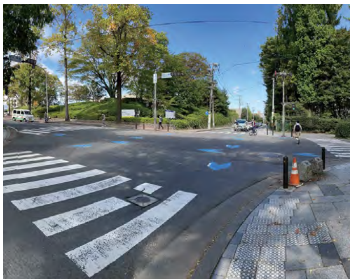
▲仙台二高前の交差点

「歩行者専用現示方式」は、すべての方向の自動車等を同時に停止させている間にすべての方向の歩行者等を同時に横断させる方式であって、斜め方向の横断を認めないものをいいます。また、自転車が歩行者用信号に従って横断する際にも、自転車から降りて横断してください。これからも東北大生としての責任を自覚し、交通ルールをしっかりと守って、安全に利用しましょう。