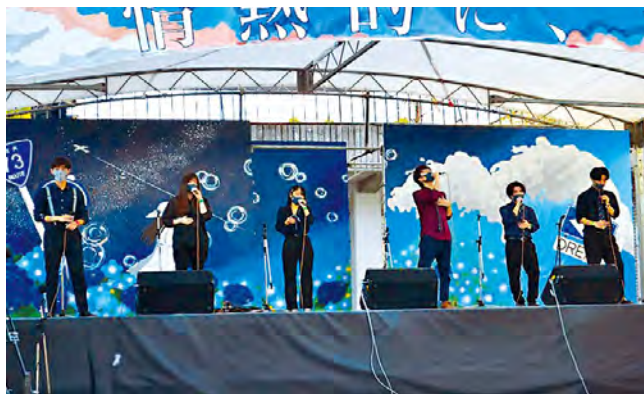
▲学友会アカペラコーラス部の活動風景

年間行事については、年2～3回行われる部内ライブ、最も多くのバンドが演奏を披露する学祭、選考会を勝ち抜いたバンドのみが参加できる定期演奏会・Winter Liveなど、様々なライブがあります。他にも外部のイベントや大会への出演を目指すバンドも多数あり、音楽を楽しみたい人から音楽を突き詰めて上手くなりたい人まで幅広く活動できます。