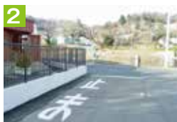
2 保育園の玄関付近では、園児の安全確保のため、十分注意して通行しましょう。