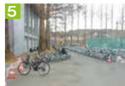
5 体育館利用者の通行のため、体育館玄関前には駐輪しないようにしましょう。