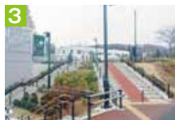
3 市道から駐輪場へは、階段中央のスロープを利用して自転車を引き上げて上がり下さい。降りる際にも必ず自転車を引いて利用して下さい。