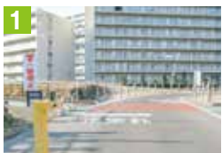
1 遊歩道との交差点です。必ず一時停止を行いましょう。

また、次の5箇所は歩行者や自動車と接触する危険がありますので、通行するときには十分注意しましょう。