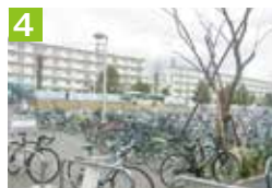
4 キャンパスの出入口通路にはみ出して駐輪しないで下さい。満車の際は空いている他の駐輪場を利用しましょう。